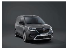
URBAN GRÅ (KPW) Solid lakk