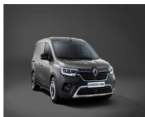
CASSIOPEE GRÅ [KNG] Metallic lakk