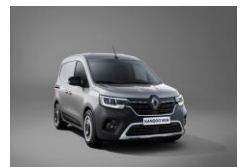
HIGHLAND GRÅ (KQA) Metallic lakk