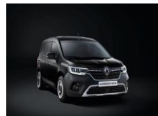
SORT (GNE) Metallic lakk