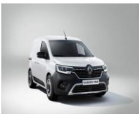
HVIT (QNG) Solid lakk